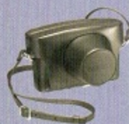
カメラケース(色●こげ茶)

すら繰り返す以外にありませんでした。さらにフォーカルプレーンシャッターについては布幕式を採用。セルフタイマーとともに、S3復刻において培ったノウハウを生かしながら、感触や音までオリジナルに限りなく近づくための繊細な作業を施しました…。