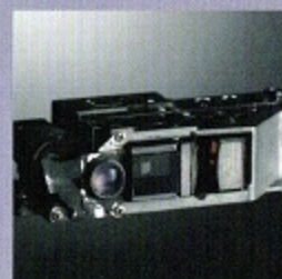
安全内蔵式ユニバーサルファインダー。 左側は広角2種の焦点距離のレンズに対応。 右側は標準から望遠まで4種の 焦点距離のレンズに対応する 等倍ファインダーが組み込まれている。

1957年といえば、今からもう約半世紀も昔の話。その当時、国内外プロカメラマンから絶大な評価を受け、以来「伝説の機種」として謳われ続けてきた距離計連動式カメラ、それがニコンSP。このカメラを蘇らせることは、ニコンにとって永年の課題であり、必ず実現したい夢でもありました。