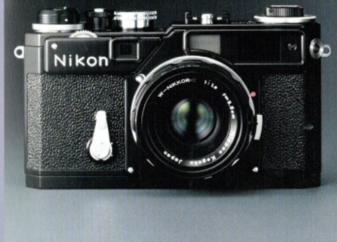
希望小売価格 ¥690,000(税込 ¥724,500) / W-Nikkor 3.5cm F1.8・レンズキャップ・レンズフード・カメラケース付

※写真は、実際の証明書とデザイン・仕様が異なる場合がございます。製品番号はSP 0001からSP 2500までの連番となります。(レンズもボディ本体と同じ連番による番号)尚、商品の製品番号の指定はできません。