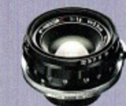
W-Nikkor 3.5cm F1.8 装着レンズはW-Nikkor 3.5cm F1.8 5群7枚のガラスを用いた 広角レンズ。現在のニッコール レンズと同じマルチコーティング を新たに施しており、より優れた 色再現性を実現しています。