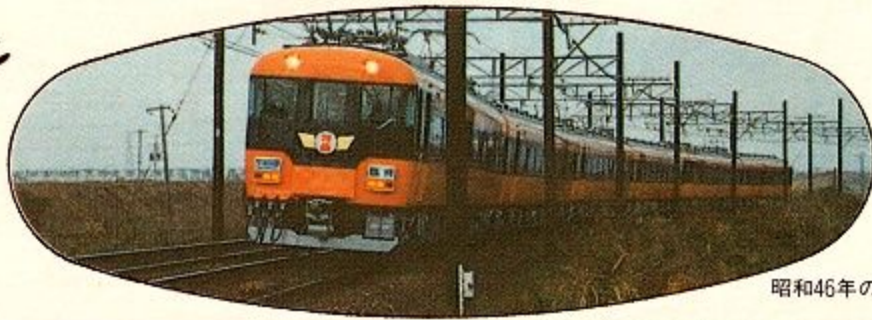
昭和46年のお召列車 12200系