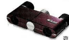
遊 4×10D CF ワインレッド