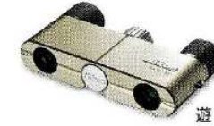
遊 4×10D CF シャンパンゴールド