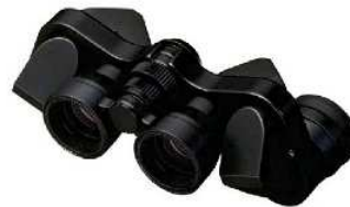
ミクロン 7×15 CF ブラック