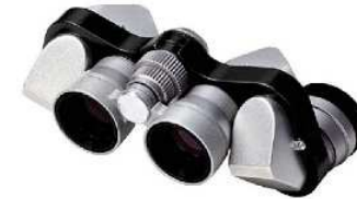
ミクロン 6×15 CF