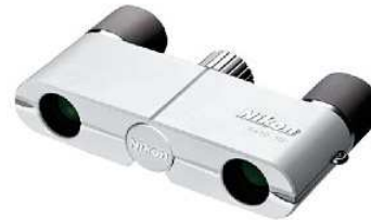
遊 4×10D CF ホワイト