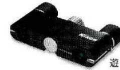
遊 4×10D CF エボニーブラック